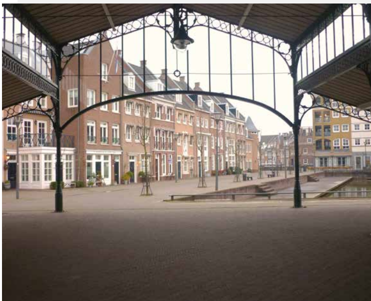
Brandevoort is een woonwijk met volop variatie in architectuurstijlen