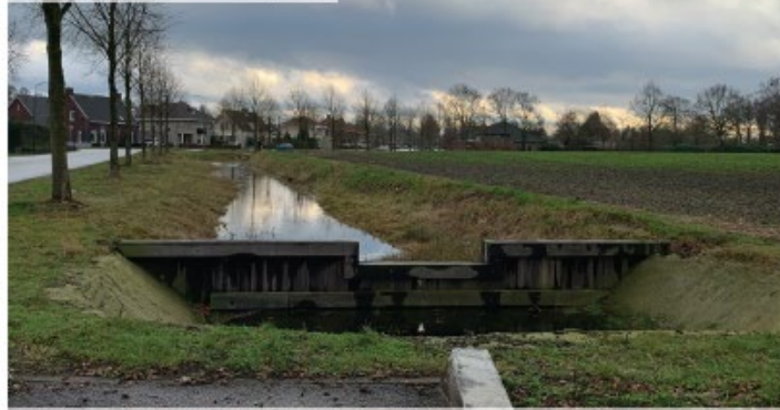
Watergang met natuurlijke oever aan oostzijde plangebied