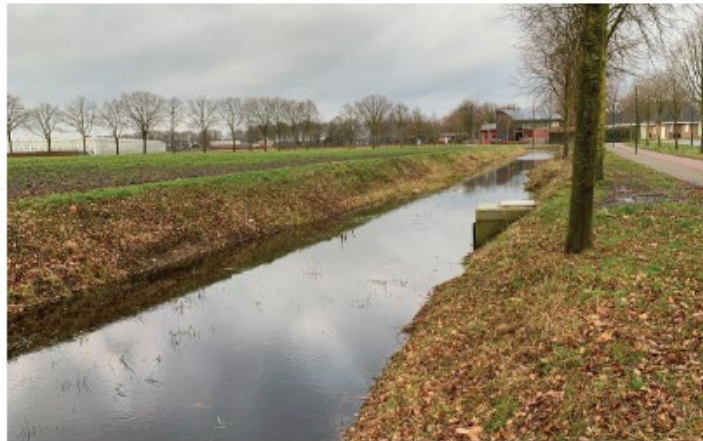
Delen van onderzoeksgebied liggen hoger t.o.v. omgeving